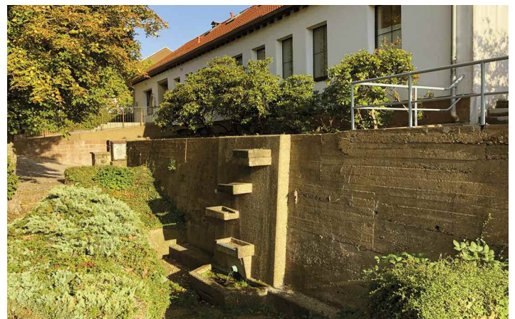
Neugestaltung Brunnen am Ärztehaus Angedacht ist auf Anregung der SPD-Ortsratsfraktion eine neue Konzeption mit dem Ziel einer Nutzung als Kneipanlage ab 2021/2022.