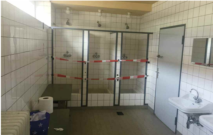
Duschräume der Schulturnhalle 100.000 €, Zuschuss 70.000 € in 2020 sowie 50.000 €, Zuschuss 30.000 € in 2021 Erste Aufträge sind bereits vergeben.