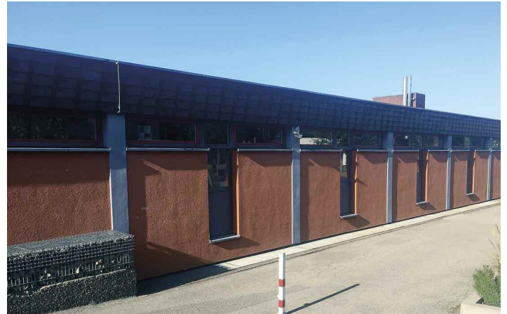
Schule Siersburg, Dachsanierung (Werkstattgebäude) in 2021: 150.000 €, Zuschuss 75.000 € sowie Erneuerung der Leitungsnetze in 2021: 32.000 €