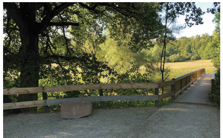
Sanierung Geländer der Brücke über die Nied und behindertengerechte Rampe 2. Bauabschnitt in 2020: 13.000 € und in 2021: 100.000 €, Zuschuss 90.000 €