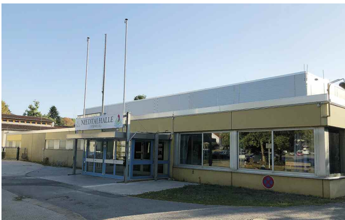
Sanierung Niedtalhalle (Duschräume, Fenster) 230.000 €, Zuschuss 207.000 € Damit wird das Projekt der grundhaften Sanierung fortge- führt.