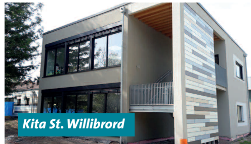
Kita St. Willibrord