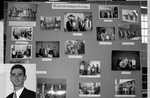
Neben einer Chronik des Ortsvereins gab es auch eine Fotoausstellung