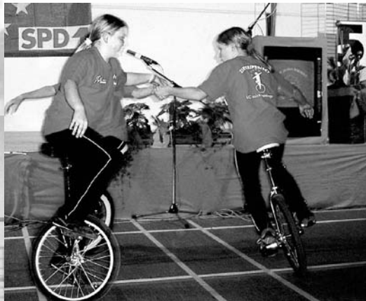
Das Zirkusprojekt des LC Rehlingen