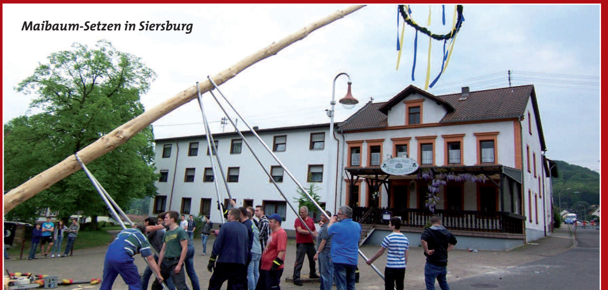
Maibaum-Setzen in Siersburg