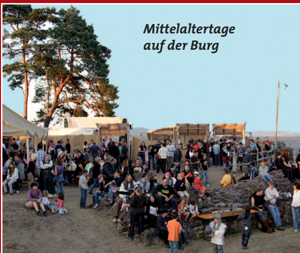
Mittelaltertage auf der Burg