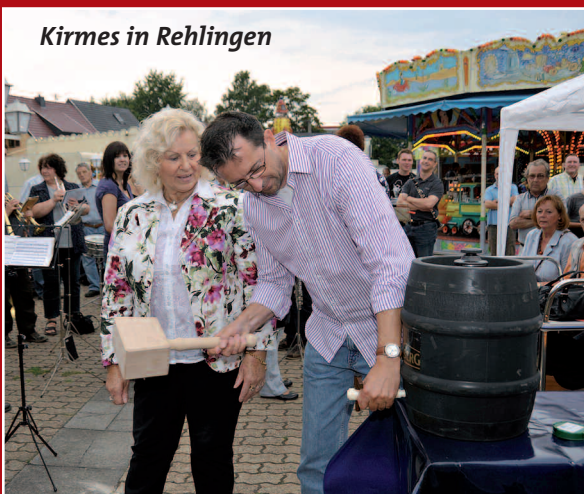
Kirmes in Rehlingen