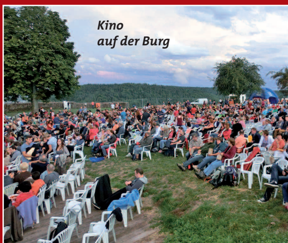
Kino auf der Burg