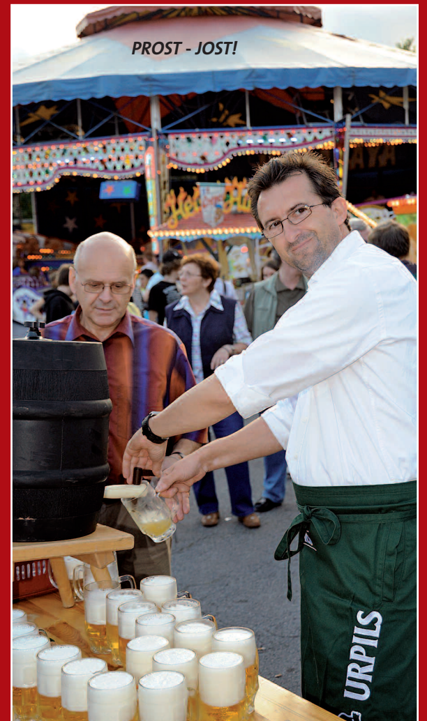
PROST - JOST!