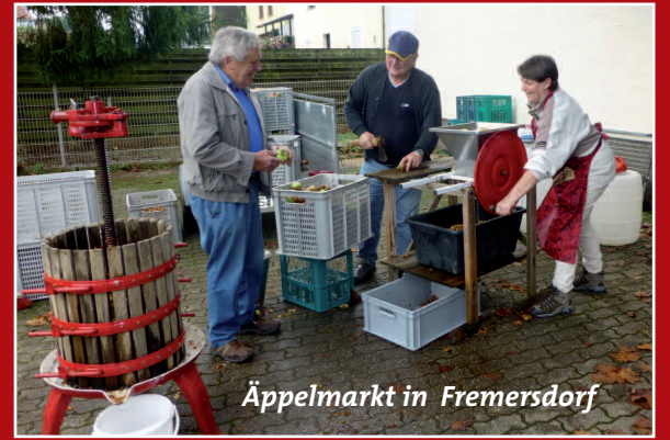
Äppelmarkt in Fremersdorf