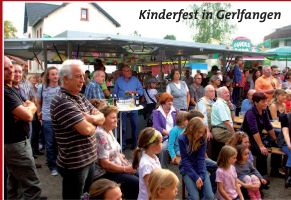
Kinderfest in Gerlfangen