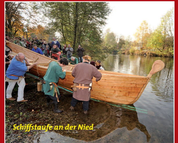
Schiffstaufe an der Nied