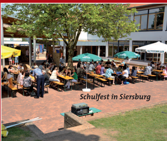
Schulfest in Siersburg