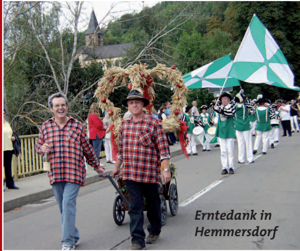
Erntedank in Hemmersdorf