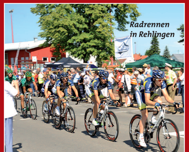
Radrennen in Rehlingen